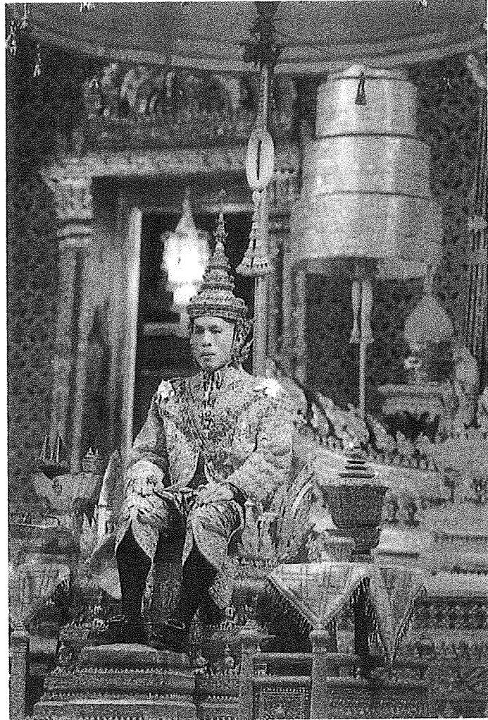
พระบรมฉายาลักษณ์ พระบาทสมเด็จพระเจ้าอยู่หัว