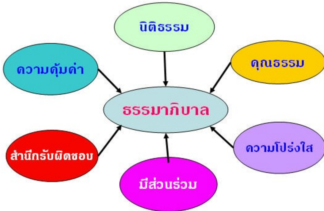
รูปที่ ๑ หลักการสำคัญของธรรมาภิบาล